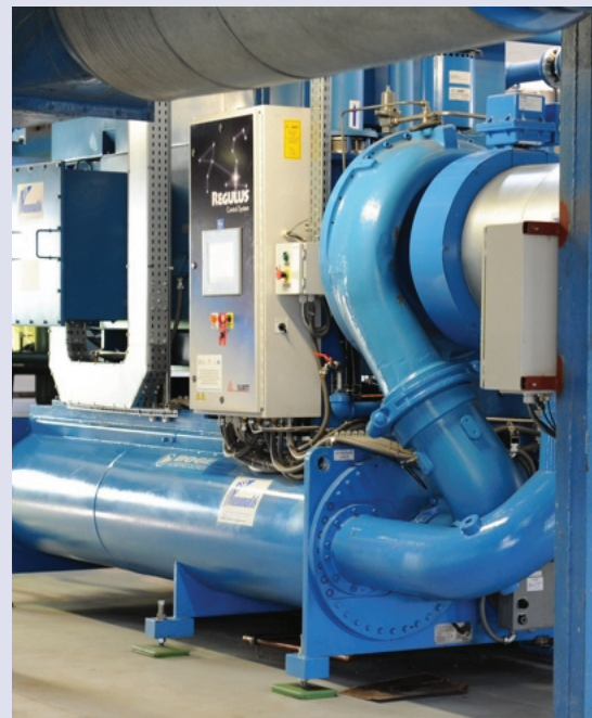
Pneumatic Spółka Akcyjna – Budowa Inteligentnej Stacji Sprężonego powietrza opartej o innowacyjną technologię SSN-PRO-VIS Działanie 1.1. Bezpośrednie wsparcie sektora mikro, małych i średnich przedsiębiorstw dziedzina: rozwój firm