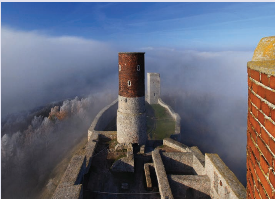
Zamek Królewski w Chęcinach historycznym miejscem mocy Ziemi Świętokrzyskiej. Kompleksowe zagospodarowanie Wzgórza Zamkowego i organizacja ponadregionalnego wydarzenia „Oblężenie Chęcińskiej Warowni”. Działanie: 2.3. Promocja gospodarcza i turystyczna regionu