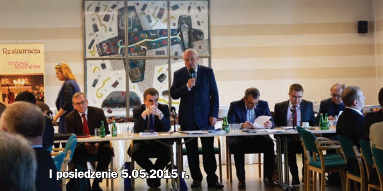
I posiedzenie 5.05.2015 r.