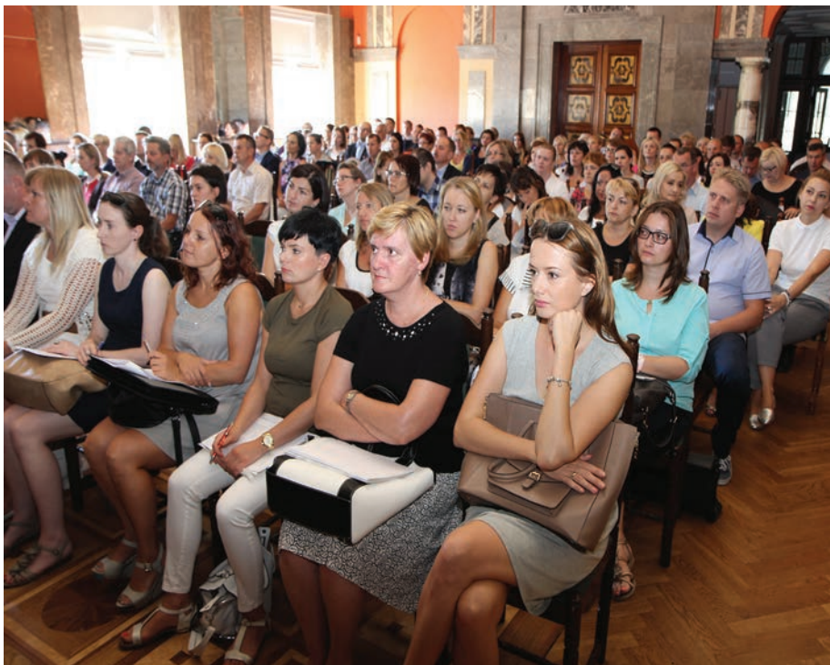
Możliwość wsparcia szkolnictwa zawodowego i edukacji przedszkolnej w ramach RPOWŚ 2014-2020, 20.08.2015 r. WDK w Kielcach