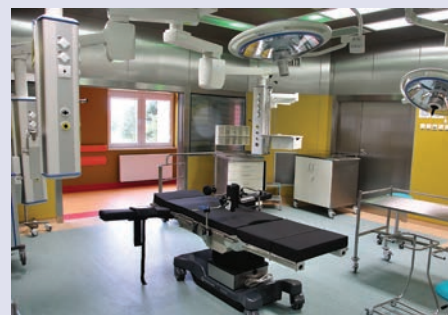
Wojewódzki Szpital Zespolony w Kielcach Rozbudowa Świętokrzyskiego Centrum Kardiologii o Kardiologię i Kardiologię. Działanie 5.1. Inwestycje w infrastrukturę ochrony zdrowia