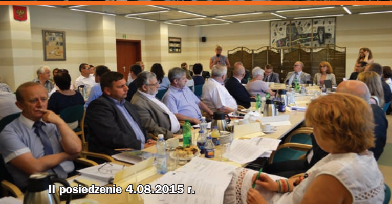
II posiedzenie 4.03.2015 r.