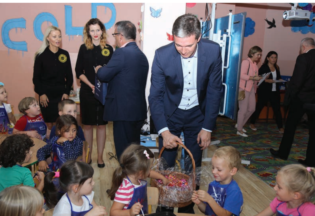
Symboliczny start konkursów z nowej perspektywy finansowej:

Ostatni z zaplanowanych w tym roku konkursów umożliwi zorganizowanie kompleksowej pomocy dla osób, doświadczających wykluczenia w wymiarze zawodowym, społecznym, zdrowotnym czy edukacyjnym. Można będzie tworzyć projekty, przewidujące organizację kursów, podnoszących kwalifikacje, a także staże czy subsydiowane zatrudnienie, poradnictwo zawodowe i pośrednictwo pracy, poradnictwo indywidualne i grupowe oraz reintegrację społeczną i zawodową, realizowaną przez Warsztaty Terapii Zajęciowej, Zakłady Aktywności Zawodowej, Kluby Integracji Społecznej i Centra Integracji Społecznej.