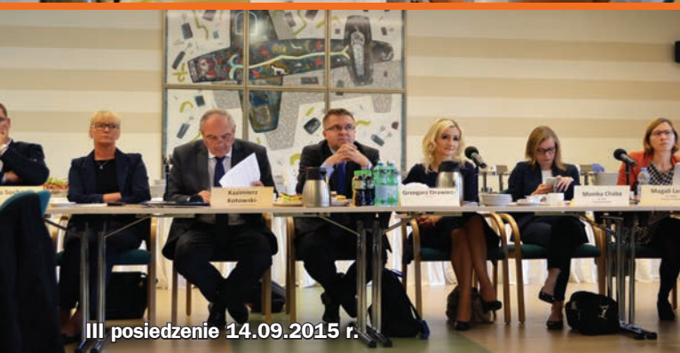
III posiedzenie 14.09.2015 r.