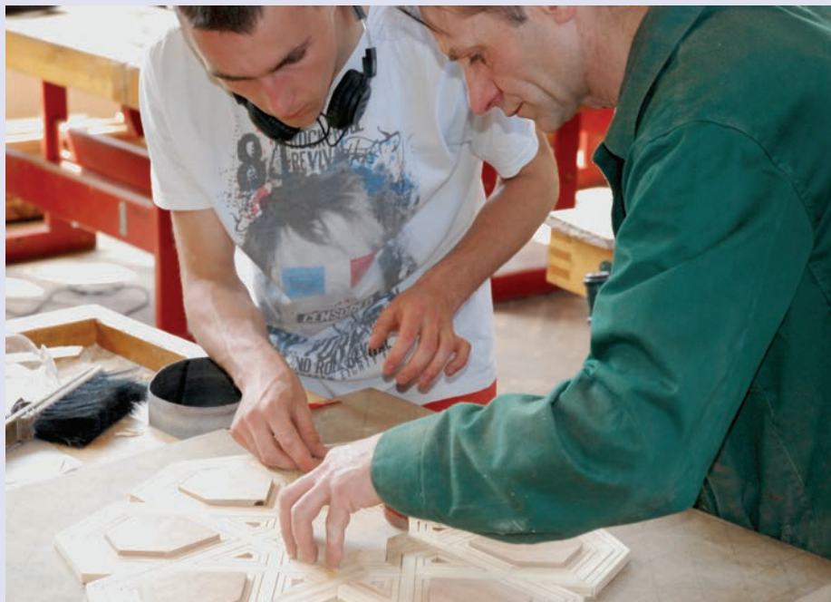
Uczeń Zespołu Szkół Plastycznych w Kielcach, uczestnik projektu ponadnarodowego pt. „Sztuki plastyczne drogą do utrwalenia dziedzictwa kulturowego narodów”, realizowanego przez Wojewódzki Dom Kultury w partnerstwie z hiszpańską Akademią Cordoba w ramach Działania 9.2 PO KL