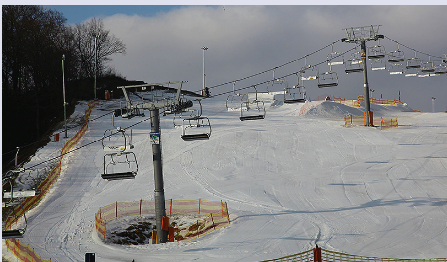
Szwajcaria Bałowska Budowa nowego stoku narciarskiego jako wspólna inwestycja powiązania kooperacyjnego na rzecz wzrostu konkurencyjności i atrakcyjności turystycznej Regionu Świętokrzyskiego. Działanie: 1.2. Tworzenie i rozwój powiązań kooperacyjnych przedsiębiorstw