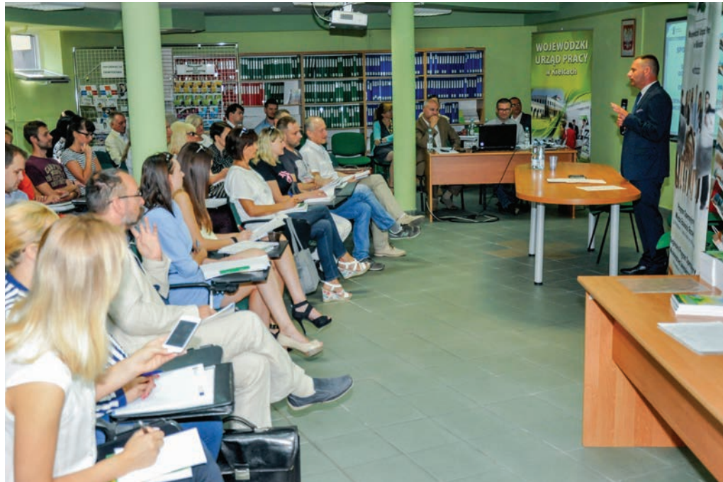
Spotkanie informacyjne dla beneficjentów dotyczące RPOWŚ i PO WER 2014-2020

Działania 10.2 i 10.4 w ramach RPOWŚ skierowane są dla osób po 29 roku życia. Aby efektywność była jak najwyższa, sklasyfikowano grupy osób, które wymagają wsparcia w pierwszej kolejności. Będą to: kobiety, osoby 50 plus, niepełnosprawni, długotrwale bezrobotni, osoby z niskimi kwalifikacjami, osoby sprawujące opiekę nad osobą zależną oraz powracające na rynek pracy po zakończonym okresie sprawowania opieki. Z bezzwrotnych dotacji w działaniu 10.4 dodatkowo korzystać mogą osoby odchodzące z rolnictwa. Nabory uczestników do projektów planowane są od drugiej