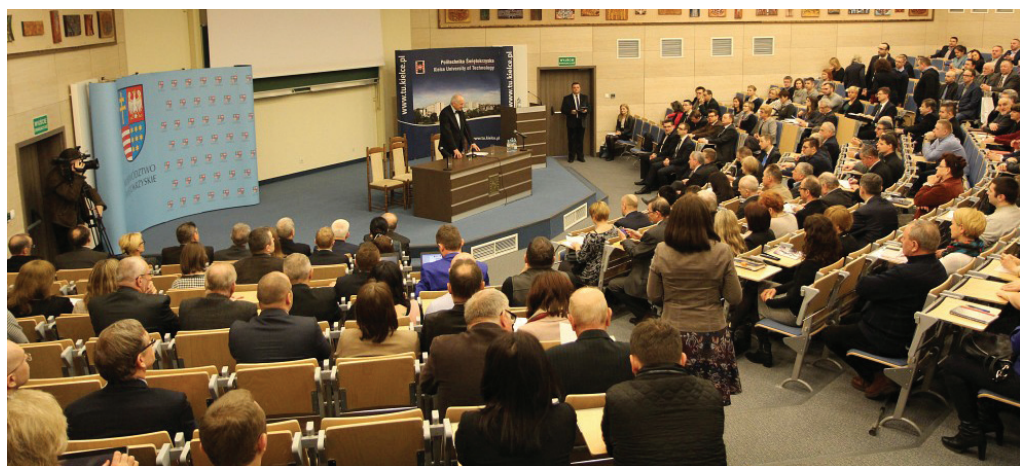
Konferencja inauguracyjna RPOWS 2014-2020. Politechnika Świętokrzyska 16.02.2015 r.

na: rozwój e-społeczeństwa, tj. e-usług (e-administracji, e-zdrowia, e-kultury), zasobów danych przestrzennych, digitalizację oraz rozwój infrastruktury informatycznej. Ponadto dla terenów, które tracą swój dotychczasowy charakter społeczno-gospodarczy zaprogramowano działania nakierowane na rozwój i gospodarcze wykorzystanie wewnętrznego potencjału przynależnego danemu terytorium. Nie zabrakło oczywiście inwestycji w infrastrukturę ochrony zdrowia i usług społecznych. Założono także działania w zakresie infrastruktury dydaktycznej szkół, szkolnictwa zawodowego i wyższego oraz infrastruktury przedszkolnej. Wyżej wymienione działania są infrastrukturalnym odniesieniem do inicjatyw podejmowanych z Europejskiego Funduszu Społecznego.