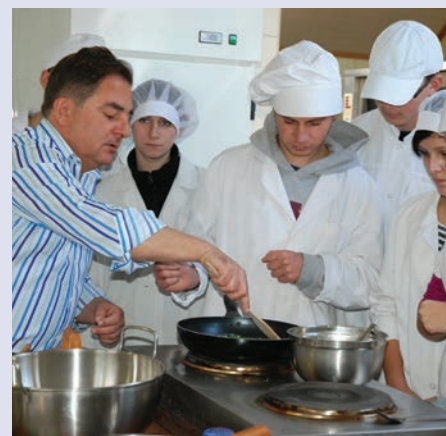
Uczniowie Zasadniczej Szkoły Zawodowej w Skarżysku-Kamiennej, uczestnicy projektu pt. „Mój zawód najlepszą inwestycją”, realizowanego przez Zespół Placówek Edukacyjno-Wychowawczych w ramach Działania 9.2 PO KL